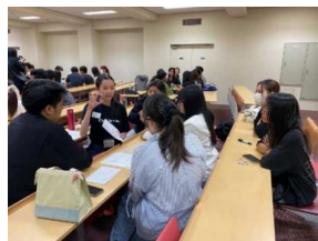
日本語学校生をゲストに招いての交流

課程履修の登録は2年次前期に行いますが、1年次前期から必修科目「日本語教育学入門」や「異文化間コミュニケーション」、「日本語学概論Ⅰ・Ⅱ」があり、基礎となる知識や態度について学びます。2年次には必修科目「日本語教授法」や「日本語教材研究Ⅰ」（選択科目）、3年次には教育実習関連の科目があります。これらの科目を通じて、実践的な技能や知識、態度を段階的に身につけていきます。