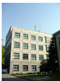
キャンパス入口付近/K棟